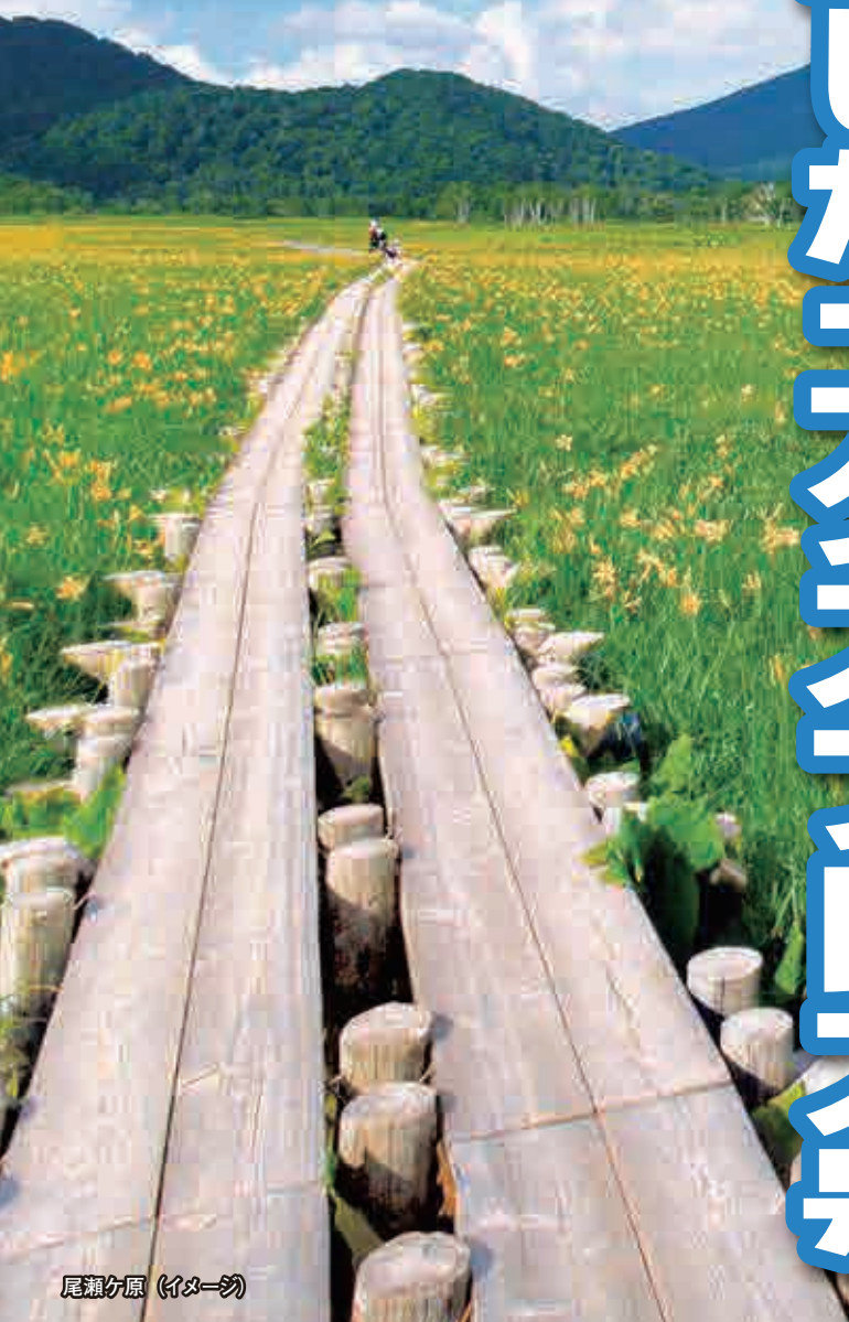
尾瀬ヶ原 (イメージ)