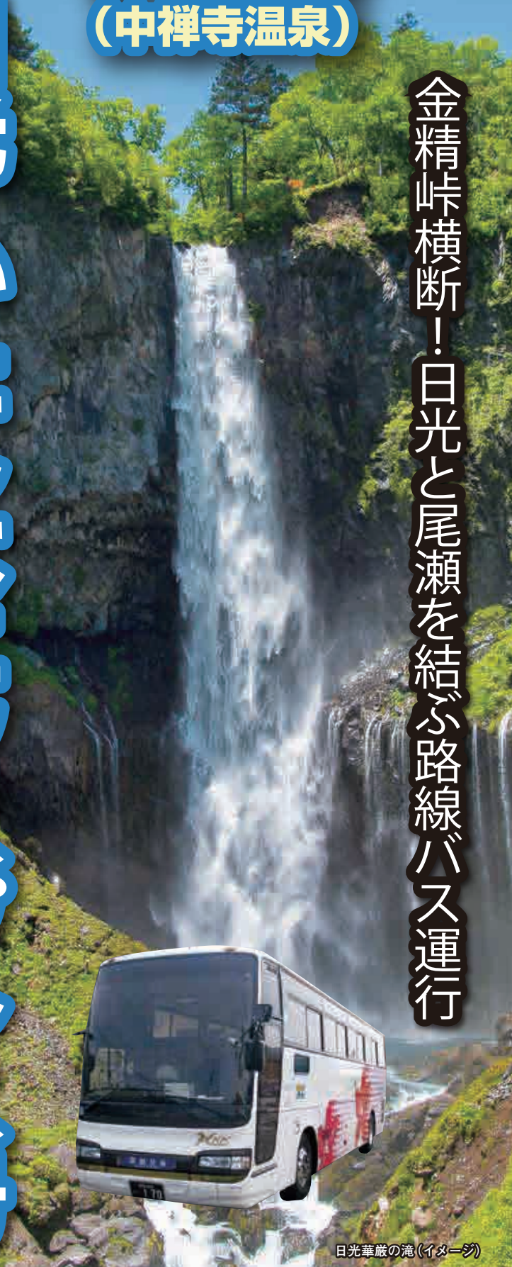
日光華嚴の滝 (イメージ)