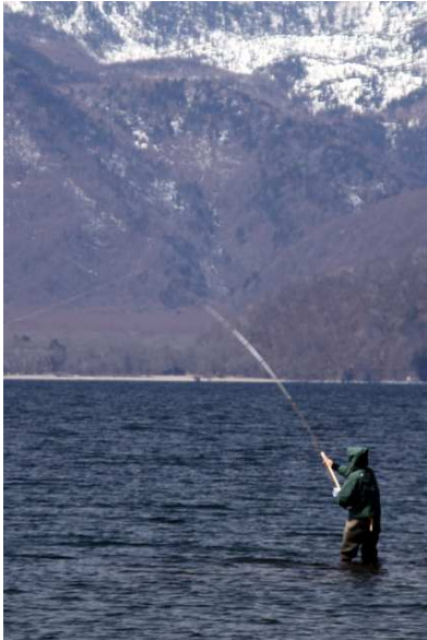
4/1 中禅寺湖岸釣り解禁