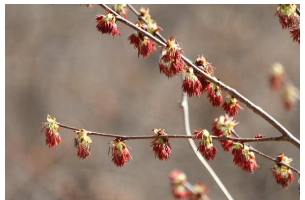
4/4 フサザクラ (馬返し)