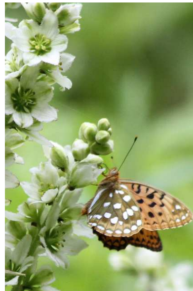
7/10 バイケイソウ・ギンボシヒョウモン