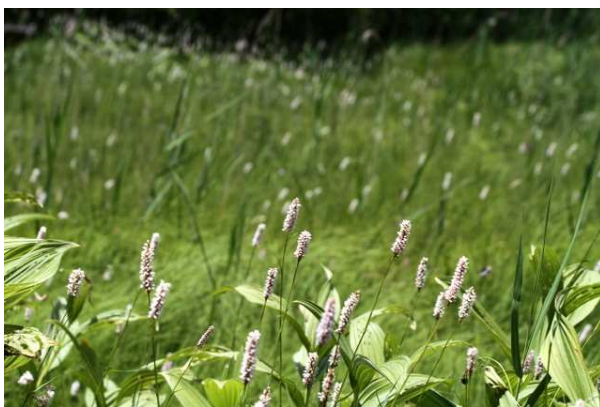
7/11 イブキトラノオ群落 (戦場)