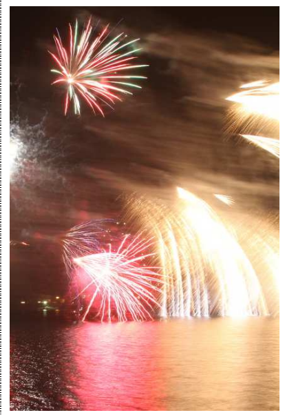
8/22・26 湯ノ湖花火(イメージ)