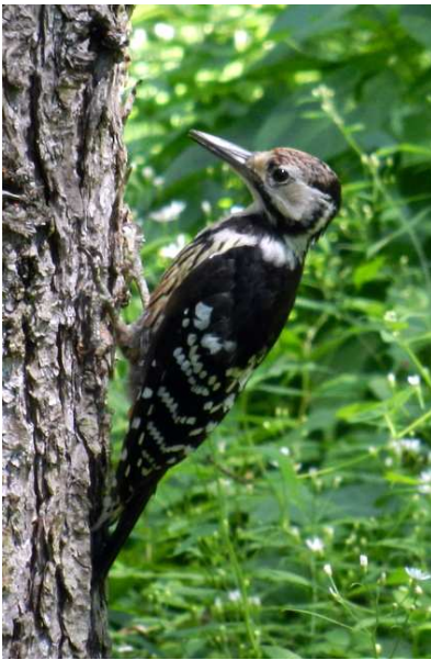
8/12 オオアカゲラ幼鳥(西ノ湖)