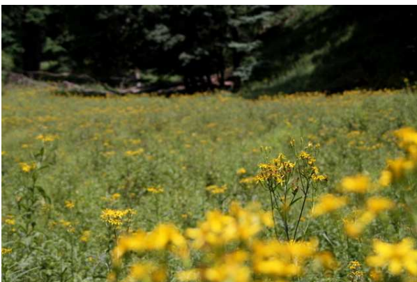
8/13 キオンの花畑(弓張峠付近)