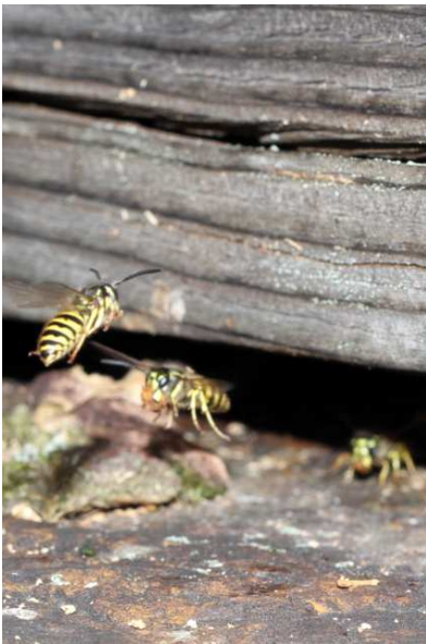
8/19 キオビクロスズメバチ(湯元)