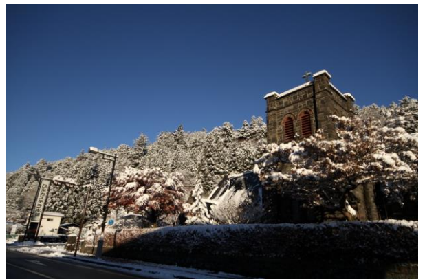
11/25 真光教会（旧市街地）