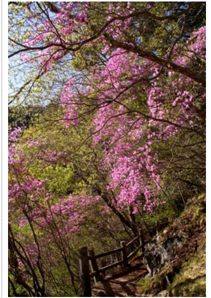
5/10 トウゴクミツバ(中禅寺湖)