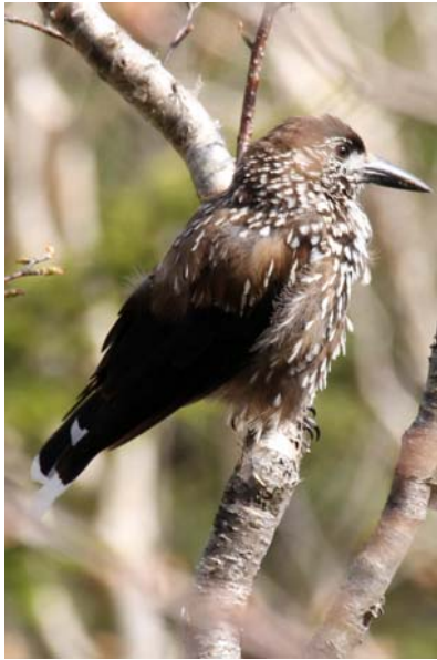
5/15 ホシガラス(男体山)