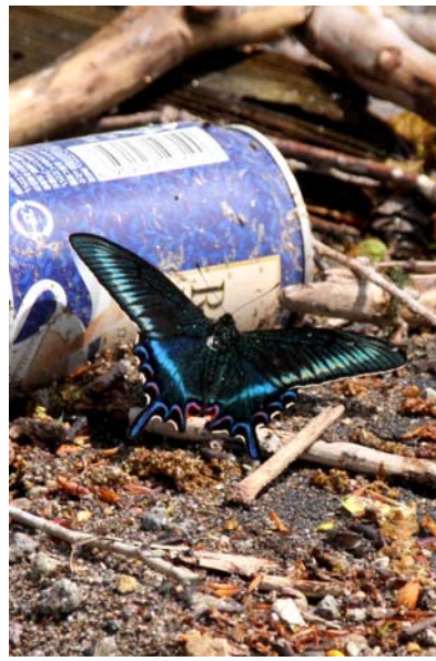
5/16 ミヤマカラスアゲハと… (千手)