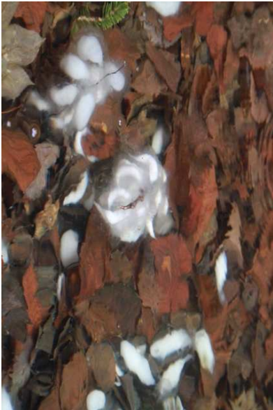
4/26 クロサンショウウオ卵塊