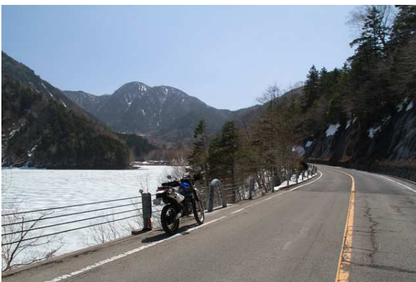
4/28 凍結中の菅沼（金精峠 群馬側）