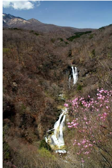
4/28 霧降滝とアカヤシオ