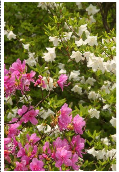
6/1 ミツバとシロヤシオ