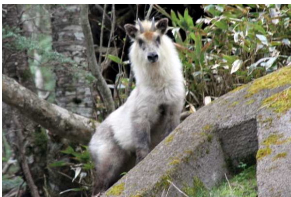
5/31 ニホンカモシカ (山王林道)