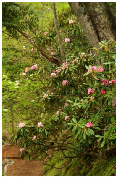
5/29 アズマシャクナゲ(湯ノ湖)