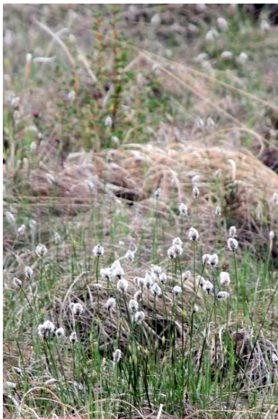
5/28 ワタスゲ(戦場ヶ原)