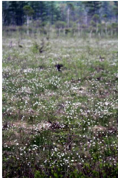
6/8 ワタスゲ (戦場ヶ原)