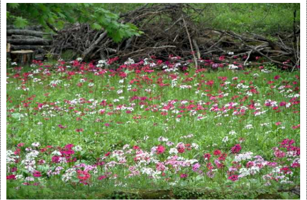
6/7 クリンソウ (千手ヶ浜 民家)