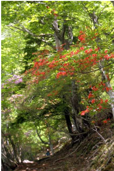
6/7 ヤマツツジ (中禅寺湖)