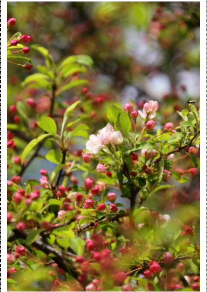
6/8 ズミ (戦場ヶ原)