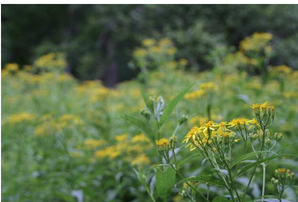
8/6 キオンの群落 (弓張峠付近)