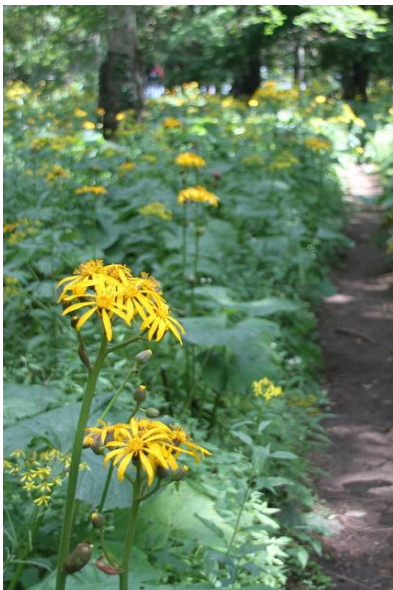
8/19 マルバダケブキ(千手ヶ浜)