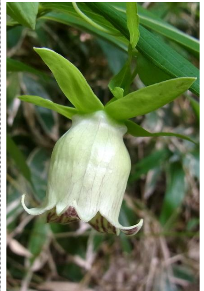
8/22 ツルニンジン(刈込湖歩道)