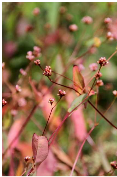
9/5 アキノウナギツカミ