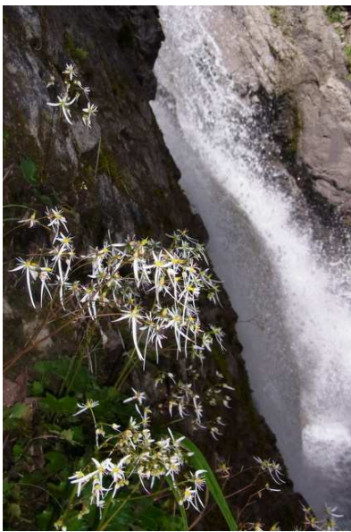
9/1 ダイモンジソウ(赤岩滝)