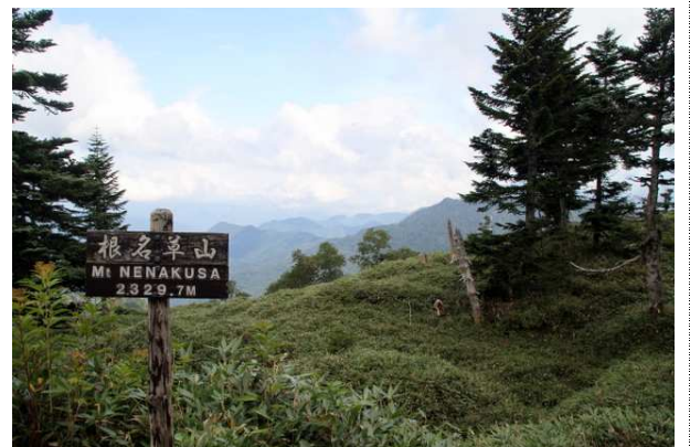
9/8 根名草山山頂より