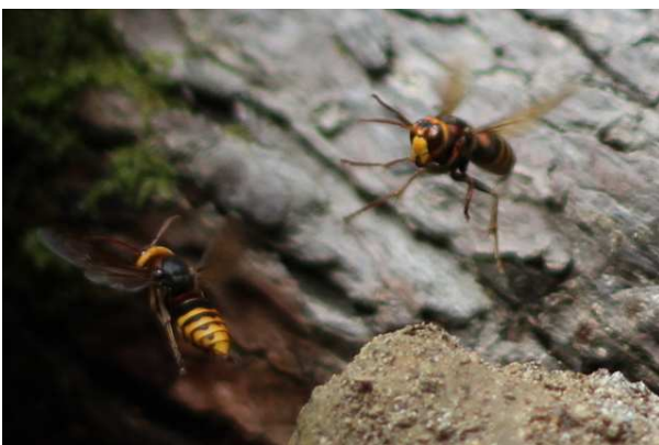
9/5 モンズズメバチ (湯川)