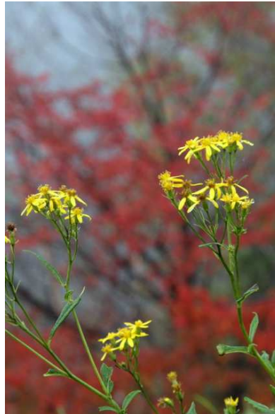
9/28 キオンとミネザクラ