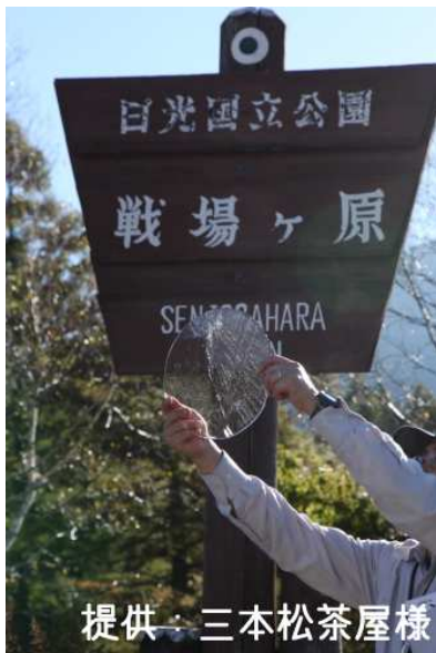
10/8 初氷 (戦場ヶ原)