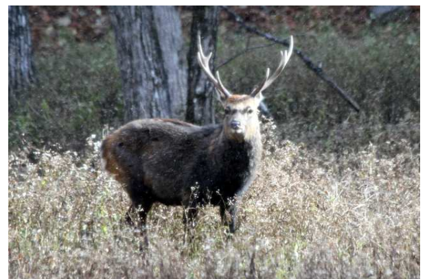
11/2 四尖雄ジカ (低公害バス路線)