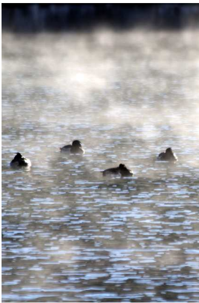
12/2 蒸気霧 (湯ノ湖)