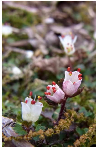
4/30 ハナネコノメ(中禅寺)