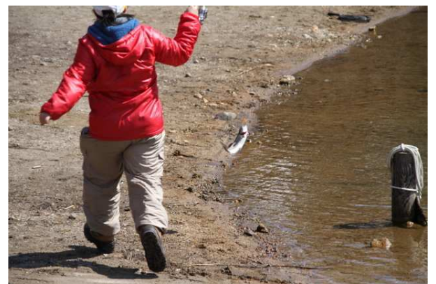
5/1 釣り解禁 (湯ノ湖)