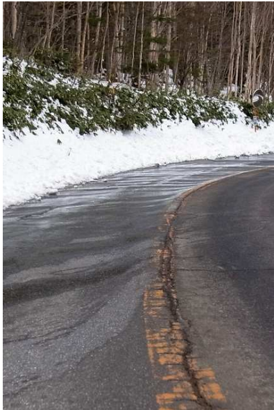
4/29 金精道路(群馬県側)