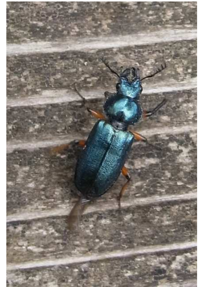
6/6 コルリクワガタ(戦場)