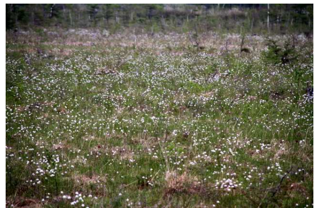
6/7 ワタスゲ(戦場ヶ原)