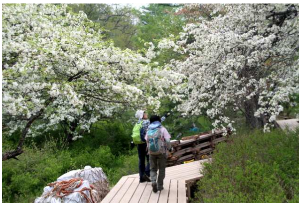
6/7 ズミ満開(戦場ヶ原)