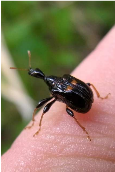
6/1 ムツモンオトシブミ(高山)