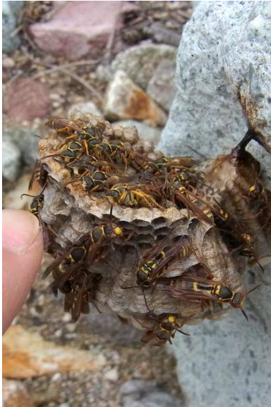
8/24 コアシナガバチ (西ノ湖)