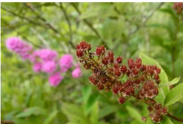
8/25 ホザキシモツケ(小田代原)