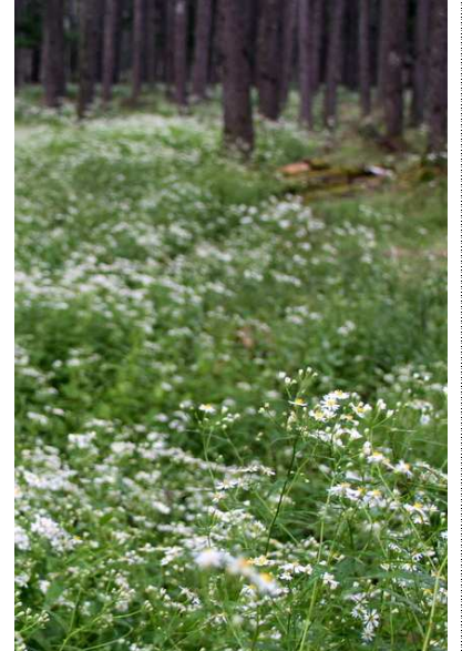
8/30 シロヨメナ群落(西ノ湖)