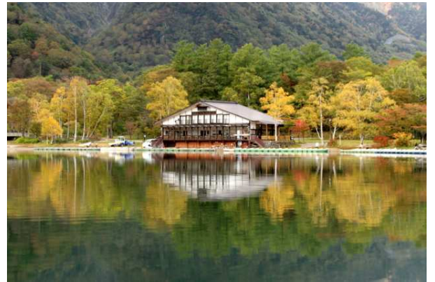
10/1 湯元レストハウス (湯ノ湖)