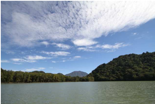
9/30 西ノ湖満水 (西ノ湖)