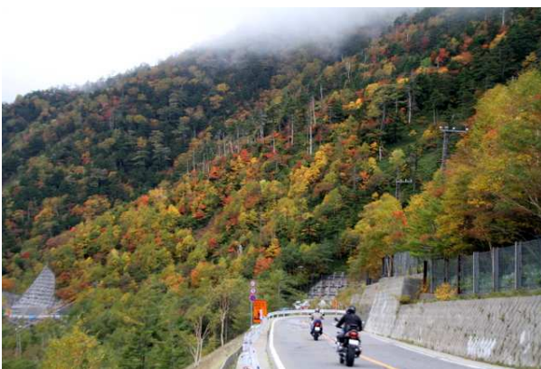
10/3 金精道路栃木県側