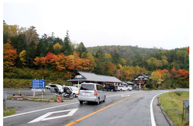
10/3 金精道路 菅沼