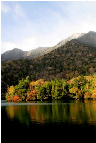
10/17 冠雪(湯ノ湖・兎島)