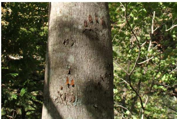
10/12 クマの爪痕新旧(切刈歩道)