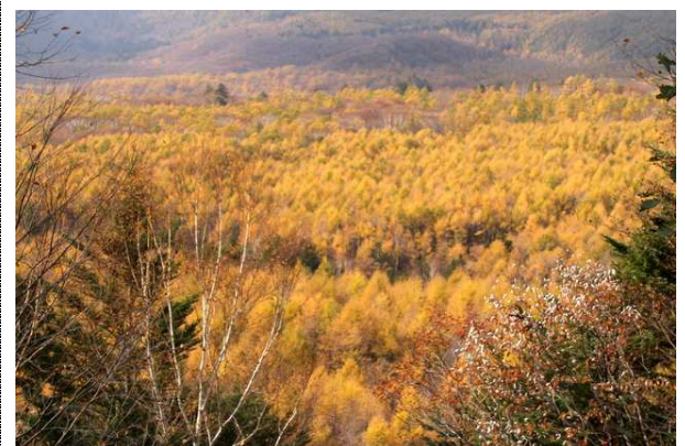
10/31 カラマツの森(光徳)