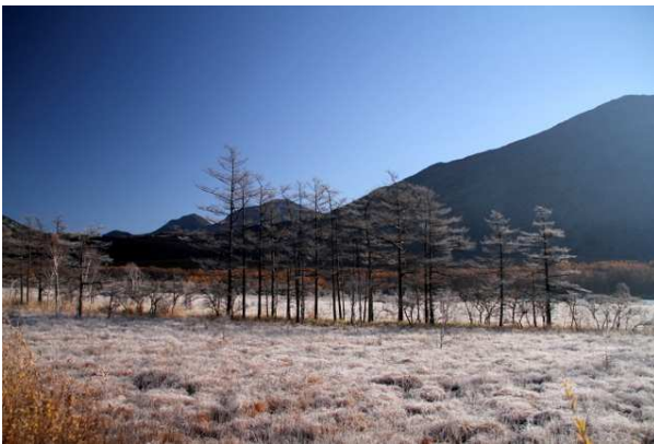
11/6 早朝 霧氷 (戦場ヶ原)