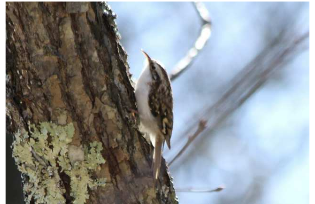
11/5 キバシリ (泉門池)