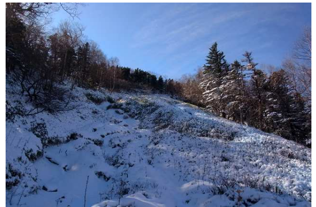
11/14 五色山国境平付近