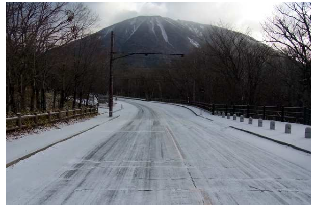
11/13 路面積雪・凍結(竜頭滝上)