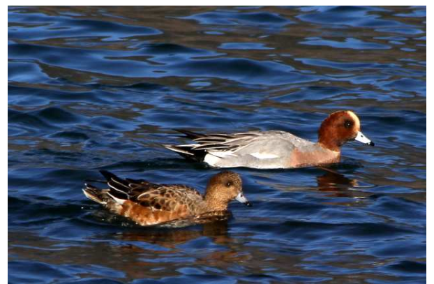
11/20 ヒドリガモ(湯ノ湖)