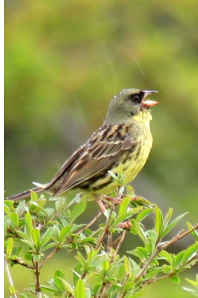
6/12 アオジ (戦場ヶ原)