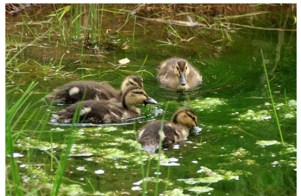
6/12 子ガモ(戦場ヶ原・湯川)