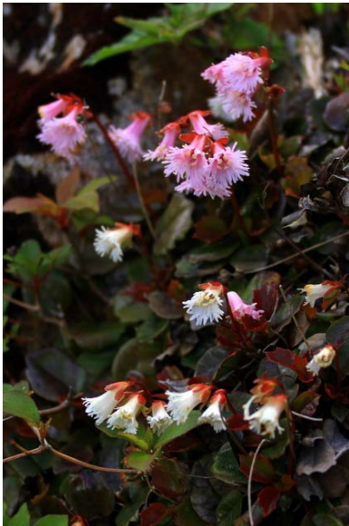
6/15 イワカガミ2種(金精山)

湯滝滝壺に3年程倒木が崩れ落ちていたが、この程駐車場を管理する自然公園財団の手により取り除かれ、優美な全貌を久しぶりに見る事が出来るようになった。 6/15 金精山に登る。岸壁にてゲンナイフウロを確認。またイワカガミ・ヒメイワカガミ、ミツバオウレン等25種の花を確認。国境平～五色山頂は残雪がかなり目立つ。山頂付近にはルリビタキの雌が多く、またその雛が足元をすり抜けて行った。霧降高原キスゲ平園地下部でニッコウキスゲが三～四分咲き程度。見頃までは10日程か？ 例年よりもやや早く見頃を迎えそうだが、標高差があるのでしばらく楽しめる。 6/18 時点では天然氷のかき氷で人気のチロリン村周辺で盛り。奥日光のクリンソウはやや盛りを過ぎた。ワタスゲも穂が崩れ始めたので見るのならばいずれも早めに。戦場ヶ原でレンゲツツジの明るいオレンジが若葉の緑に映える。週明けには全域で見頃を迎えよう。オススメは赤沼～三本松間の国道沿い。湯ノ湖畔などでミヤママタタビの葉が目立ち、葉陰に愛らしい花が揺れる。次号休刊。