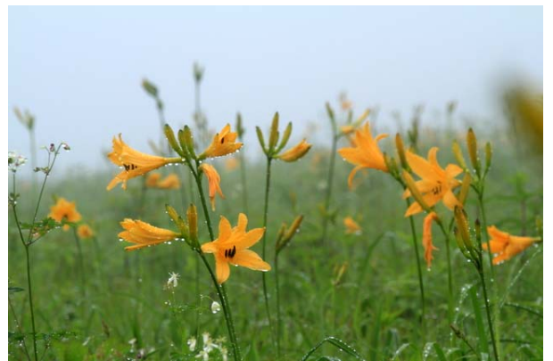
6/18 ニッコウキスゲ(霧降高原)