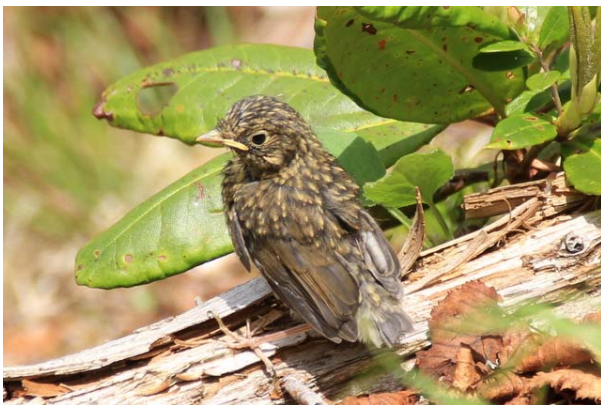
6/15 ルリビタキ幼鳥(金精山)