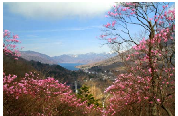
アカヤシオ開花イメージ(明智平付近)