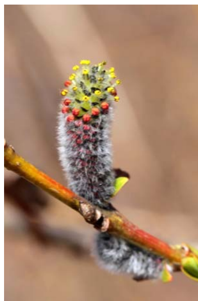
4/20 イヌコリヤナギ花穂(戦場)