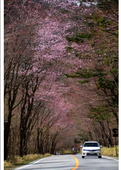
4/29 オオヤマザクラ(中禅寺大平)