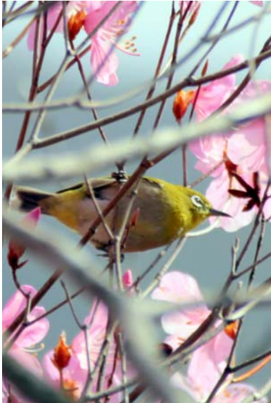
4/25 メジロとヤシオ(大平)

明智平やいろは坂上部のアカヤシオが見頃となったが、4/29は冷たい風が吹き荒れ、ケーブルカーが運休になるほどであった。見頃を迎えて後の低温・強風なので花が傷むかもしれない。同日湯元では降雪。18時時点で路面積雪は無いが、零下2度。金精道路、山王林道とも開通したばかりだか、朝夕には凍結の可能性があるので注意。夏鳥の目撃情報が増え、湯元ではイカルが鳴き始めた。概ね種類が揃ったのだろうか。バードウォッチャーに人気の戦場ヶ原では、アズマヒキガエルのガマ合戦が盛りを迎え、ミヤマウグイスカグラやワタスゲの花が咲き始めている。アカヤシオや桜の様な目立つ花に意識が向きがちだが、小さな春を探して歩くのも面白い。いろは坂下部までは新緑の盛り。GW中に霧降のツツジヶ丘は真っ赤に染まるだろう。5/1から中禅寺と群馬県片品村を結ぶ路線バスが一日2便運行される。栃木側では中禅寺・竜頭・赤沼・光徳温泉・湯元がバス停。群馬側は菅沼や丸沼を經由し鎌田まで。