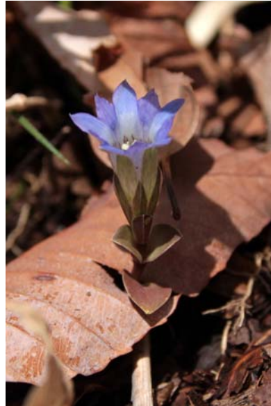
4/29 フデリンドウ(明智平)