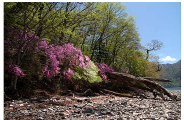
5/14 シロヤシオとトウゴクミツバ (中禅寺湖)