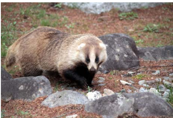
5/7 アナグマ (小西ホテル庭)