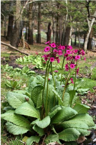
5/13 クリンソウ(菖蒲ヶ浜)

春が加速度的に進んでいる。先週中禅寺湖畔で咲き始めたトウゴクミツバは、早、盛りを過ぎシロヤシオへと移行しつつある。どちらも当たり年で、十分楽しめる。また、湯ノ湖ではアズマシャクナゲが見頃～11分程。全体に花の付きがよく、殊に湯ノ湖南端付近では花束の様に見える程である。湯滝から戦場ヶ原へと進む湯川沿いにも群落があり、そちらも見頃を迎えている事だろう。戦場ヶ原ではワタスゲの穂が見え始め、また各所でエゾハルゼミの声を聴くようになった。菖蒲ヶ浜でクリンソウが咲き始めた。千手ヶ浜でも開花が始まったとの事。竜頭滝と湯ノ湖では週明けから週半ば頃にトウゴクミツバが見頃を迎えそうだ。赤沼国道沿いのWCが修理工事の為、一週間程使用不可。駐車場内のトイレを利用。旧市街地で表参道おもてなしクーポンが販売中。クーポンと引き換えで協賛店から名産品を得られる。販売先：日光郷土センター、5枚綴り 650円。 ～9/30まで。