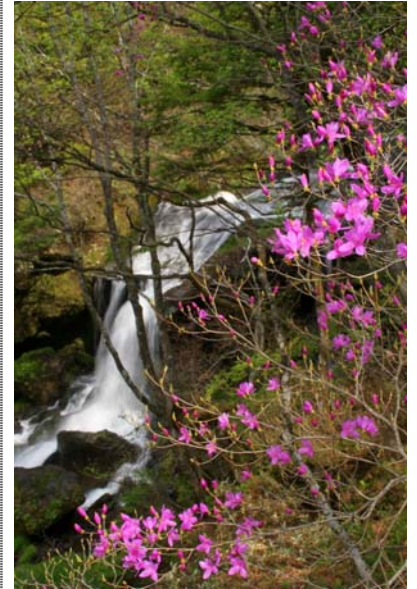
5/14 トウゴクミツバ (竜頭滝)