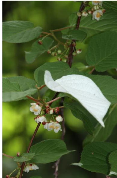
6/17 ミヤママタタビ(湯元)