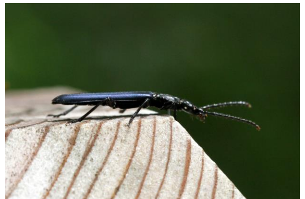
6/17 ルリヒラタムシ(小田代)