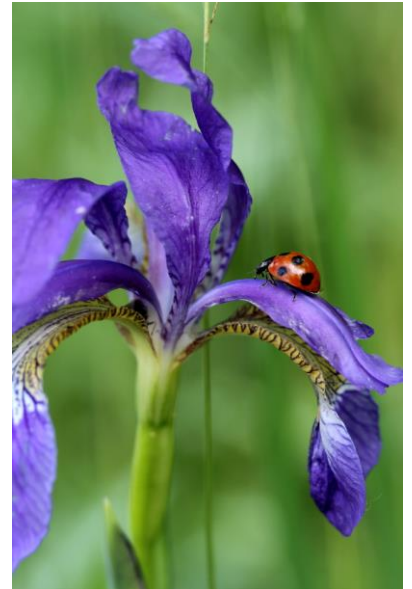
6/17 アヤメとテントウ(小田代)