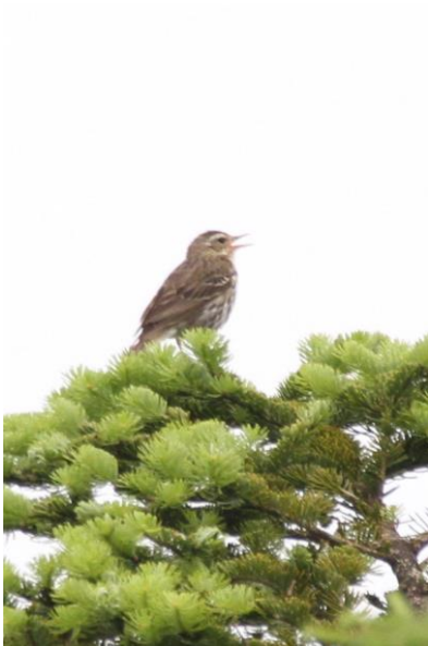
7/1 ビンズイ(霧降高原)