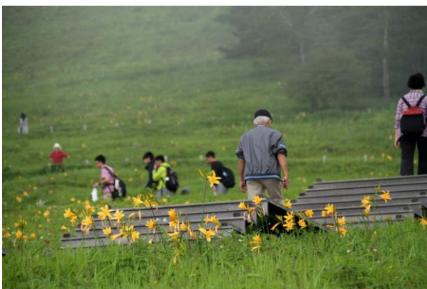
7/1 ニッコウキスゲ(霧降高原キスゲ平園地)