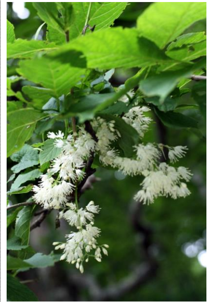
7/1 オオバアサガラ(中禅寺湖)