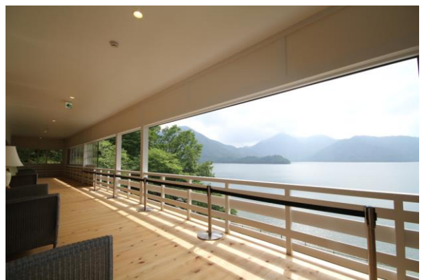
7/1 英国大使館別荘2階からの眺め