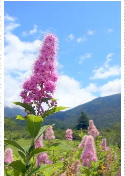
7/23 ホザキシモツケ(戦場)