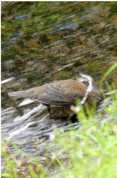
7/17 カワガラス採食(赤岩滝滝壺)

前号で伝えた小田代のノアザミが依然美しく、NHKでも放映されたようだ。夏の花ホザキシモツケも景色として見頃を迎えている。周辺はまさに花の季節。一日歩くと30種を優に超える程の花々に出会えるだろう。また、湯元スキー場ではヤナギランが見頃。かつては群落があったが壊滅状態になったものを10年以上のボランティア活動によって復活を遂げて来たもの。7/30に歌が浜の駐車場を使用し、野村萬斎ら三世代による薪狂言が行われる。これに伴い当日及び前日には周辺駐車場の利用制限が、当日夕刻には通行規制かかる。当日に英国大使館等へ赴く際には、代替交通機関として運行される中禅寺の立体駐車場前・中禅寺温泉バス停⇄歌が浜駐車場間の無料シャトルバスを使うと良い。翌7/31~8/1は男体山登拝講社大祭で、湖上花火(21時~15分)やお囃子巡回などがある。また、8/1~8/7の間は零時に山門が開門し、夜間登山が可能。7/31には夜間の路線バス運行もある。山頂からのご来光を拝めるのはこの期間のみ。 次週、休刊。