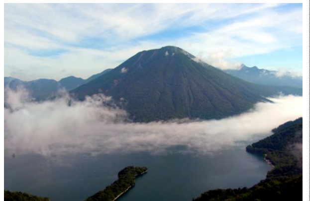
7/23 奥日光晴天(市街地雨、イロハ霧)