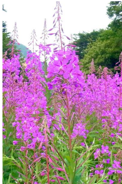
7/22 ヤナギラン(湯元スキー場)