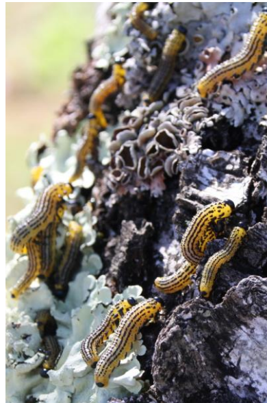
8/16 カンバルリチュウレンジ(赤沼)