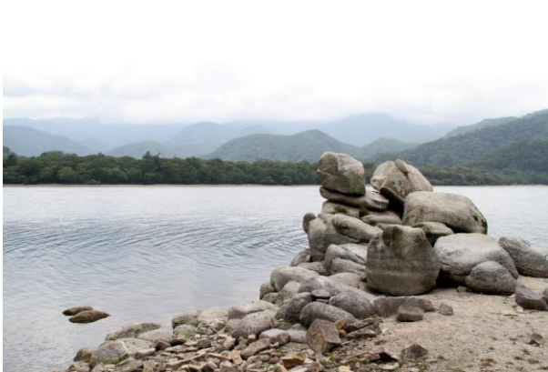
8/15 地続きとなった俵石(中禅寺湖)