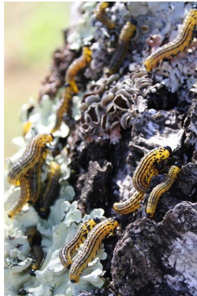
8/16 カンバルリチュウレンジ(赤沼)