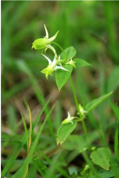
8/25 ハナイカリ(湯ノ湖)

奥日光は随分と涼しくなり、日差しが無いと20度に届かない日も増えて来た。小田代原には、薄らと草紅葉の縞模様が現れ始めた。その構成要素の一つであるホザキシモツケは未だ蕾が残る物から、既に紅葉を始めた物まで様々。同じく真っ赤に染まって彩りを増すアキノウナギツカミは花の盛り。小さな花も愛らしいが、手近にあるならば、その茎を下から上に優しく撫で上げると面白い。名の由来が解るだろう。戦場ヶ原に多いウメバチソウは一見白だけの5弁の花に見えるが、よくよく見るとその繊細さに驚かされる。またアケボノソウは訪れる蟻などの行動を見ていると、蜜の所在が意外な場所にあるのが判る。花の種類こそ減ったが、特徴的な花々が多い時期。ゆっくりと観察してみると面白い。 前回の台風で湯ノ湖や湯川は増水してきたが、西ノ湖などはあまり変化が無いようだ。中禅寺湖西岸の千手が浜では、千手堂の再建工事が進められている。