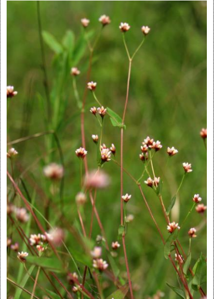
8/26 アキノウナギツカミ(小田代)