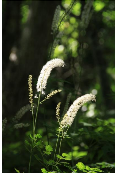
8/26 サラシナショウマ(泉門池)