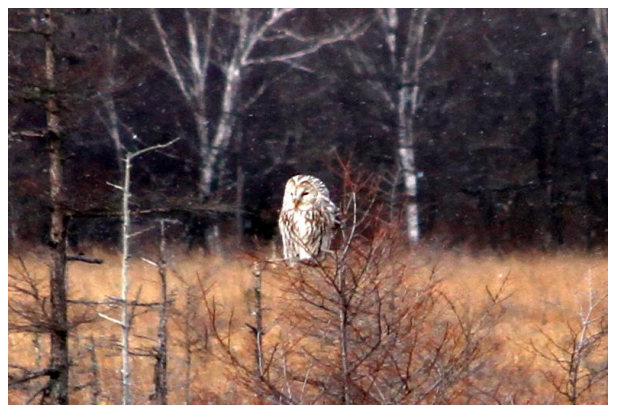
12/28 フクロウ (戦場ヶ原)