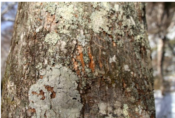
12/25 クマの爪痕(金精の森)