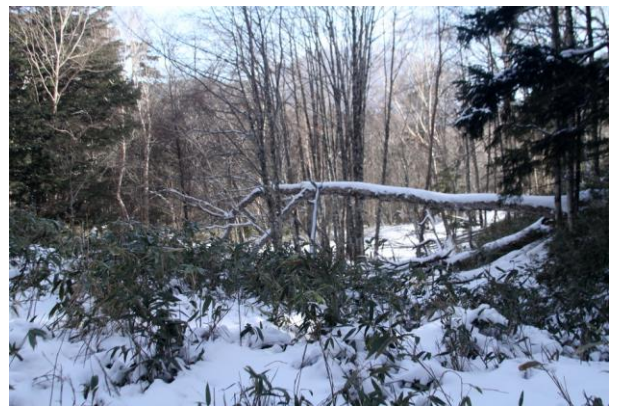
12/25 金精の森スノーシューコース