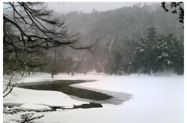
1/23 スノーシューコース 蓼ノ湖