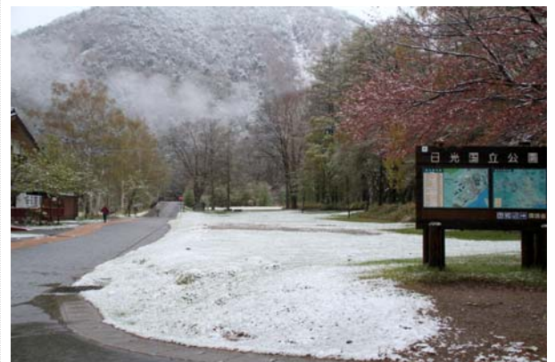
5/9 奥日光 降雪・積雪(湯元)