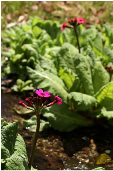
5/6 クリンソウ開花(菖蒲)