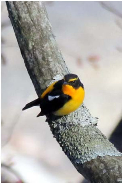
5/8 キビタキ (中禅寺湖)