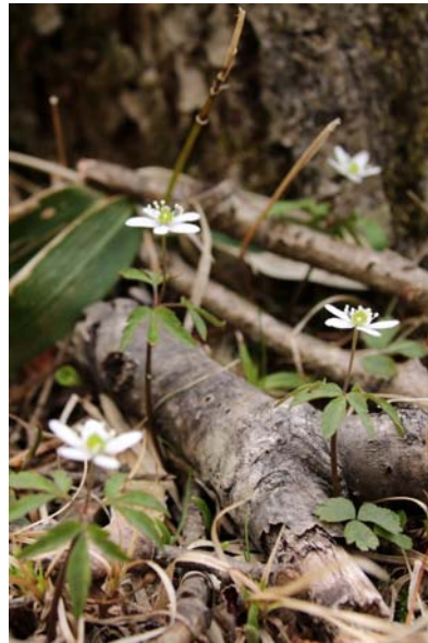
5/9 ヒメイチゲ (湯ノ湖)