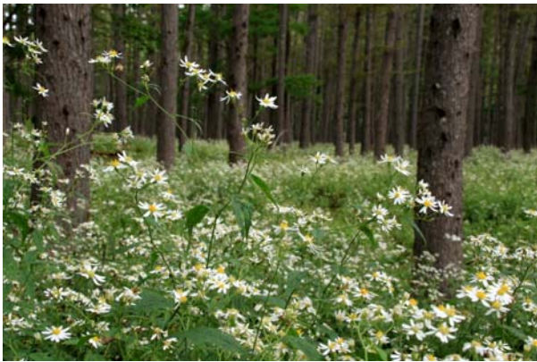
9/20 シロヨメナ群落(西ノ湖)