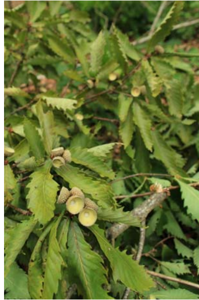
9/20 クマの食事痕(千手)