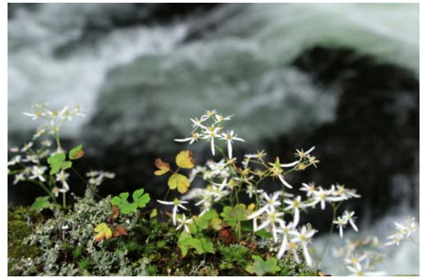
9/20 ダイモンジソウ (石楠花橋)