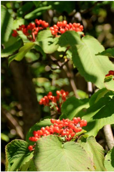
9/19 オオカメノキ実(湯元)