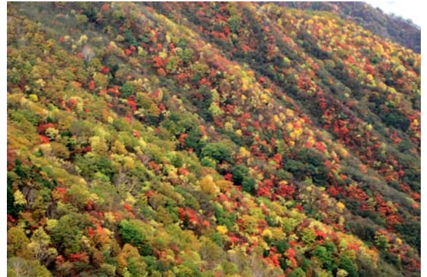
10/22 足尾山塊紅葉見頃（半月第二P）