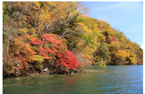
10/26 中禅寺湖北岸 紅葉七分