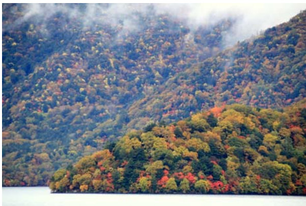
10/22 中禅寺湖南岸 紅葉六分