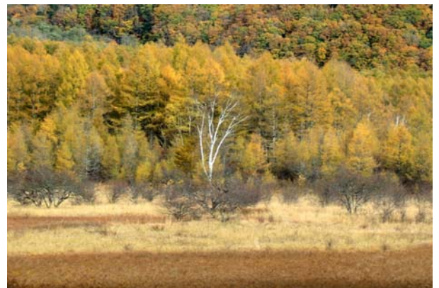
10/26 カラマツ黄葉六分（小田代）