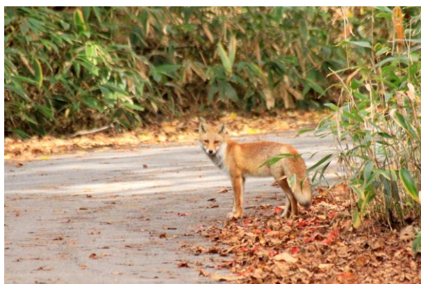
10/12 キツネ (山王林道)