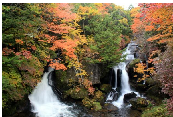
10/14 竜頭滝 紅葉見頃