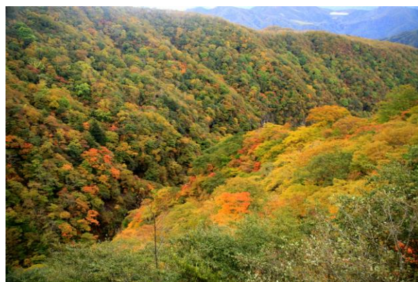
10/13 霧降六方沢 紅葉見頃