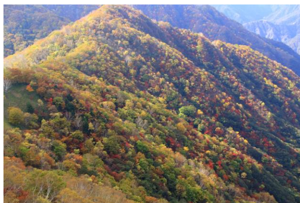
10/21 足尾山塊 紅葉見頃（半月第二P）