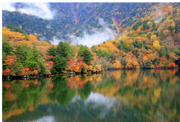
10/23 湯ノ湖 紅葉やや盛り過ぎ