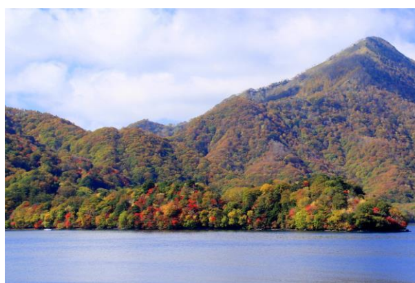
10/21 八丁出島（イタリア大使館前）