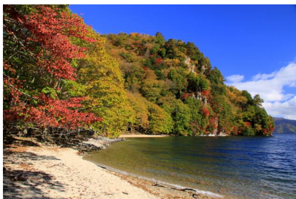
10/21 栃窪 紅葉七分（中禅寺湖畔）