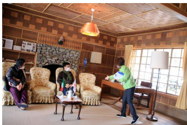
4/5 ガイドツアー (伊大使館別荘)