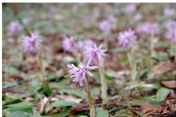
4/2 ショウジョウバカマ (日光植物園)