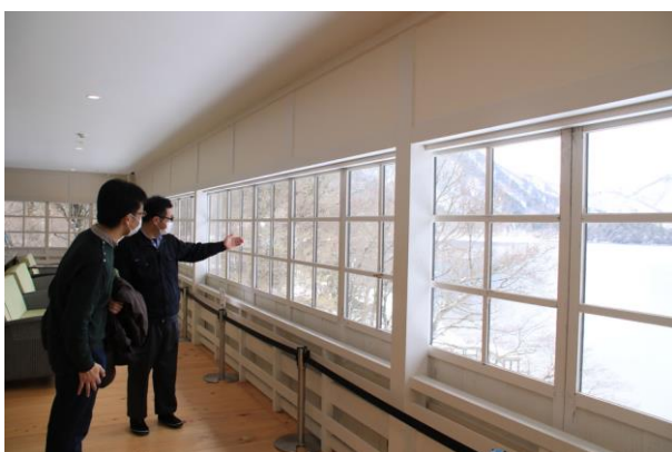
4/5 ガイドツアー (英国大使館別荘)