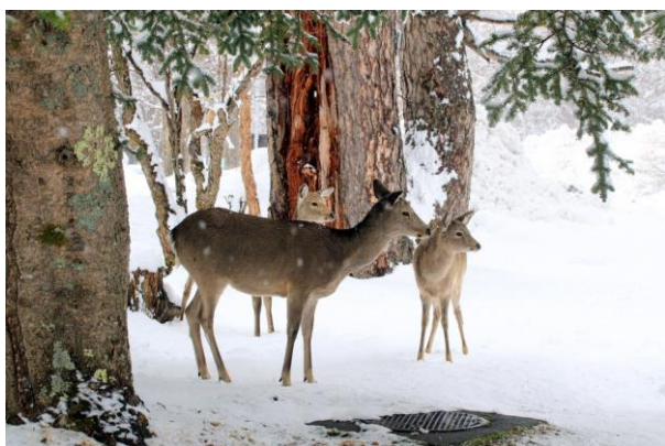
4/4 積雪とシカ (小西ホテル庭)