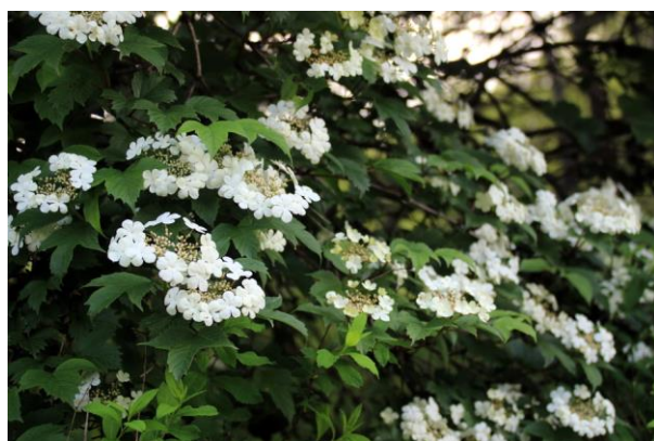
6/23 カンボク (三本松)