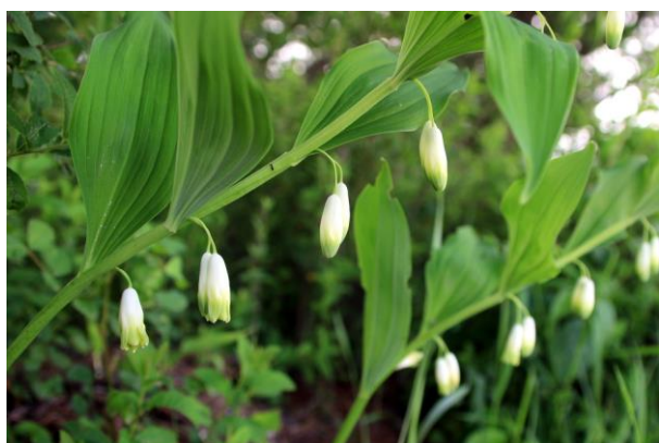
6/23 アマドコロ (三本松)