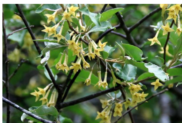
6/22 ニッコウナツグミ (竜頭滝上)