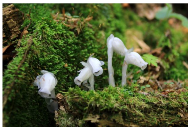
6/22 ギンリョウソウ (高山)