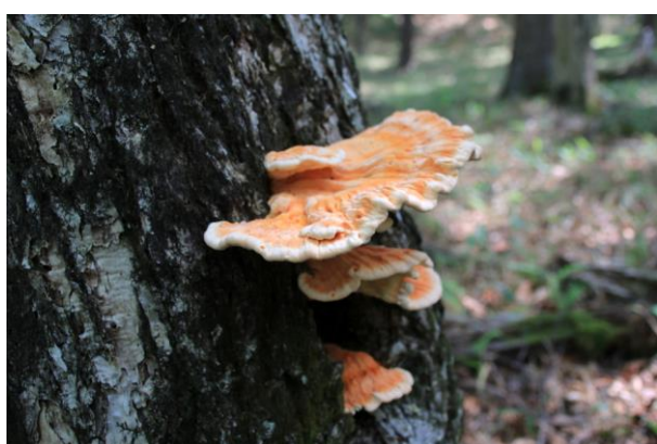
6/22 マスタケ (高山)