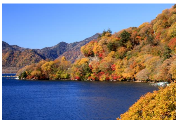
10/28 中禅寺湖北岸（金谷ホテル前）