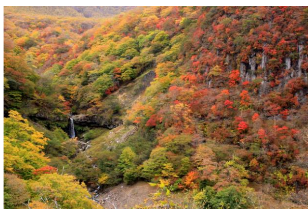
10/25 般若滝（下りいろは坂 剣が峰）