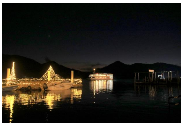
10/29～ ライトアップ奥日光