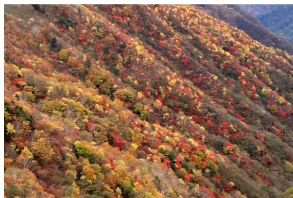
10/25 半月第二駐車場より足尾 紅葉見頃