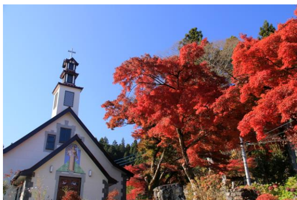
11/11 カトリック日光教会