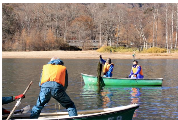
11/12 湯ノ湖 コカナダモ刈り