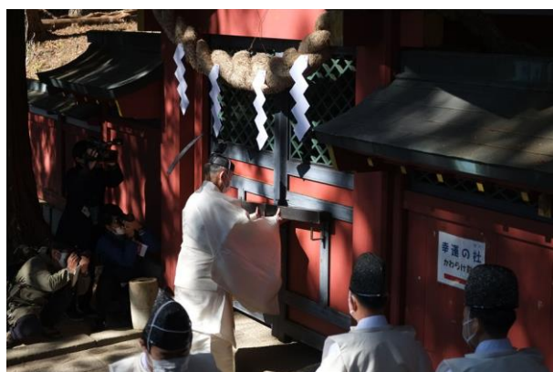
11/11 男体山閉山