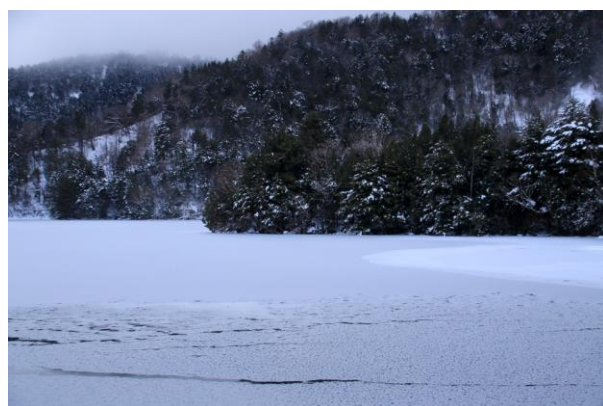
12/21 金精道路 (栃木県側)