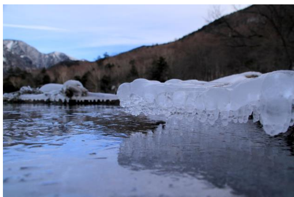
12/21 飛沫氷 (湯ノ湖)